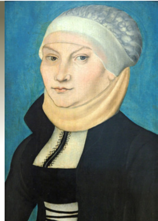
▲ Katharina von Bora oftewel Frau Luther. Portret uit 1528 door Lucas Cranach de Oudere, Niedersächsisches Landesmuseum Hannover

Dit jaar staat ook weer een aantal prachtige projecten op het programma. Het voorjaar begint met een bijzondere tentoonstelling rond zingen - want wat is een lutherse kerk zonder enthousiast gezang?