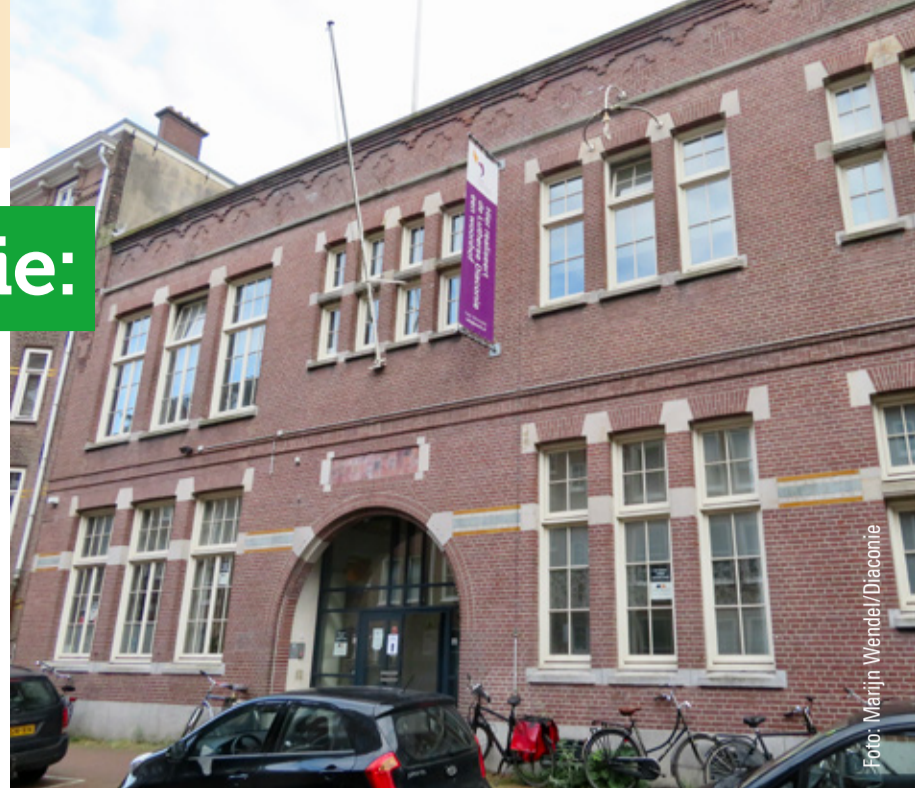
▲ Balistraat 104 in Amsterdam.

Bijzonder aan de hofjes van de Lutherse Diaconie is dat ze meer zijn dan alleen een verzameling woningen. Het zijn plekken waar mensen met verschillende achtergronden samenkomen, waar gemeenschapszin kan groeien en die zo