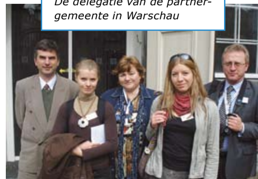
De delegatie van de partnergemeente in Warschau